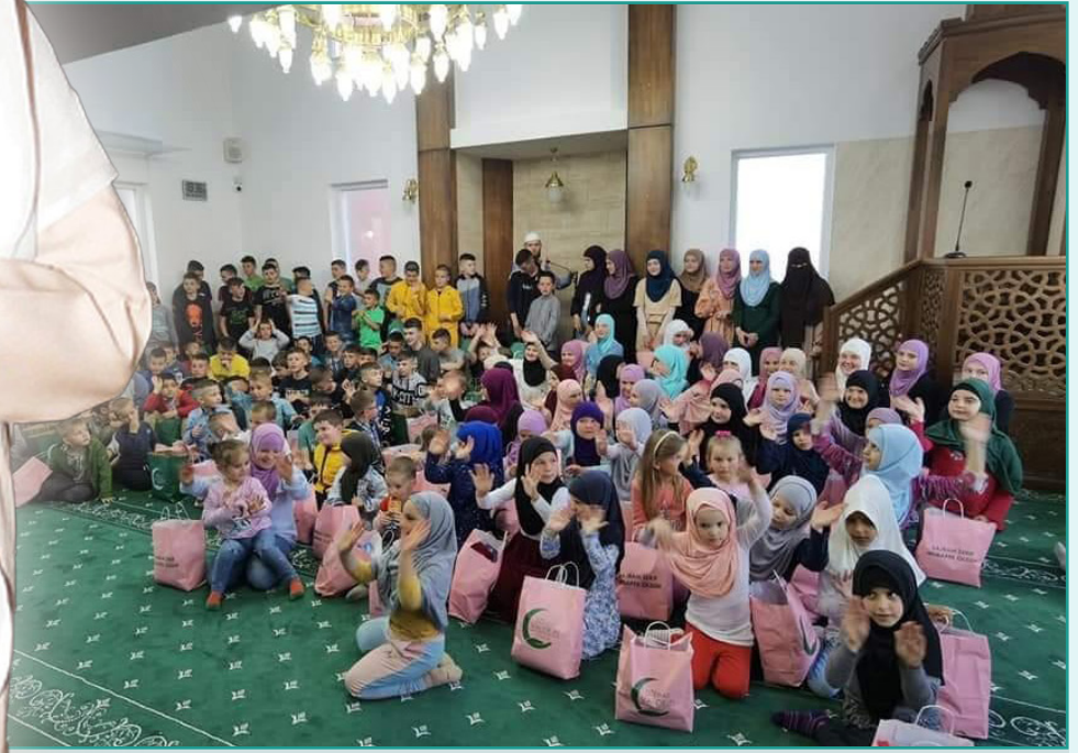
مشروع تعليم اللغة العربية (متوفرة)

لتعليم وتحفيظ القرآن الكريم، ونشر تعاليم الشريعة الإسلامية الفراء، وكفالة طلبة العلم والمعلمين والدعاة، وإقامة الدورات والدروس لتعليم اللغة العربية والدين، بالإضافة إلى تبني الجمعية العديد من المشاريع الخيرية؛ منها: حفر الآبار، وتوزيع الأضاحي وولائم الإفطار الرمضانية. وأوضح أنه بفضل الجهود المباركة للجمعية؛ تم تعليم آلاف الطلاب والدارسين حول العالم اللغة العربية، ونشر الدين الإسلامي. ودعا المعجل أهل الخير في الكويت لدعم جهود جمعية جود الخيرية والتبرع لها، حتى تستكمل مسيرتها في المشاريع الخيرية، والتي من شأنها المساهمة في نشر لغتنا العربية وتعاليم ديننا الإسلامي الحنيف، داعياً العلي القدير أن يجعل تبرعاتهم في ميزان حسناتهم.