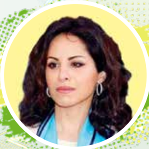
الشيخة/ مريم محمد صباح السالم الصباح (أمين السر) رئيس اللجنة الإعلامية