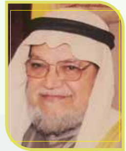
المرحوم د.عبدالرحمن السميط