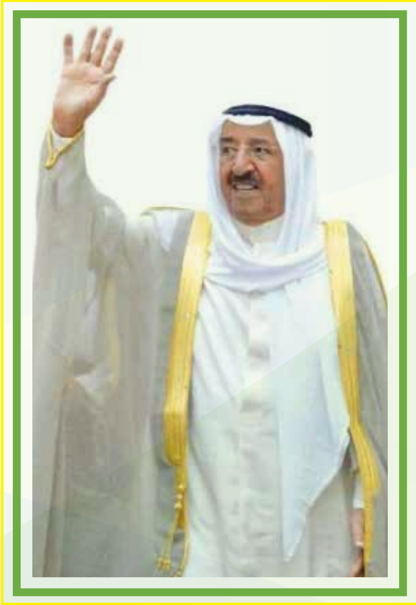
حضرة صاحب السمو أمير البلاد الشيخ صباح الأحمد الجابر الصباح