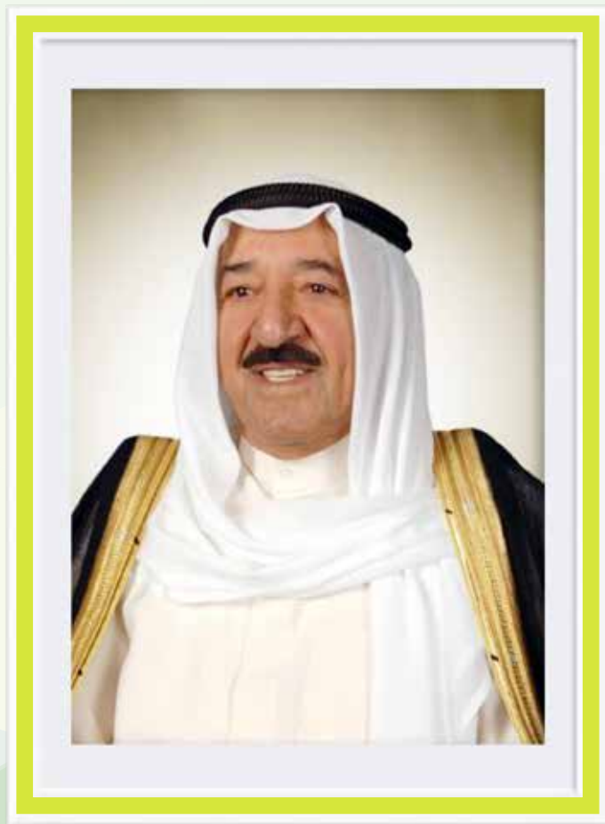
حضرة صاحب السمو أمير البلاد الشيخ صباح الأحمد الجابر الصباح