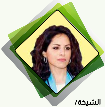
الشيخة / مريم محمد صباح السالم الصباح