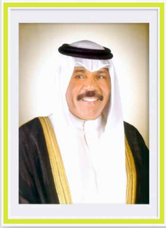
سمو ولي العهد الشيخ نواف الأحمد الجابر الصباح