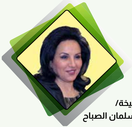
الشيخة / فريال دعيح سلمان الصباح