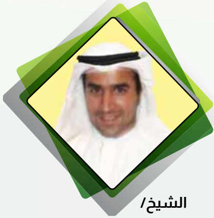
الشيخ / دعيج محمد صباح السالم الصباح