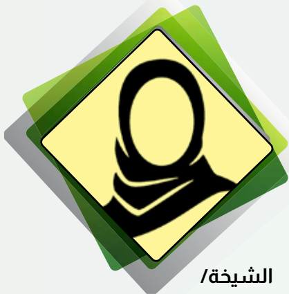
الشيخة / شريفة بدر صباح السالم الصباح