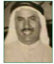
المغفور له بإذن الله الشيخ دعيح السلطان الصباح

ثواب هذا العمل لوالدها المرحوم الشيخ دعيح السلطان الصباح والرحومة والدتها منيرة الهلال المطيري، وعرضت الفكرة على عدد من المهتمين بهذا المجال الذين شاركوها في تأسيس المبرة، وحينما تلاقى رغبة جميع المؤسسين، تأسست مبرة خير الكويت كجهة نفع عام غير ربحية، وتم إشهارها من وزارة