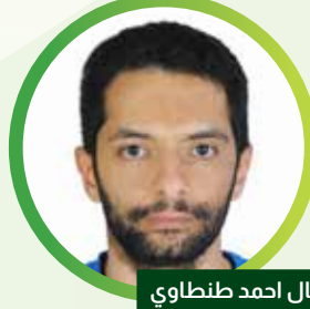
أ. كمال احمد طنطاوي