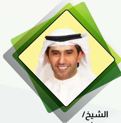
الشيخ / فيصل جابر الأحمد الصباح