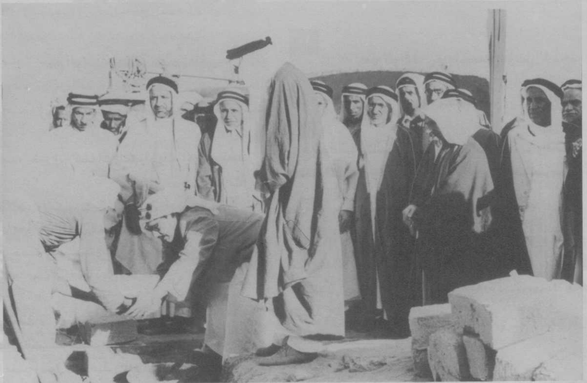
أعضاء مجلس شؤون الأوقاف برئاسة المغفور له الشيخ عبدالله الجابر يضعون حجر أساس بناء أحد المساجد في الخمسينيات