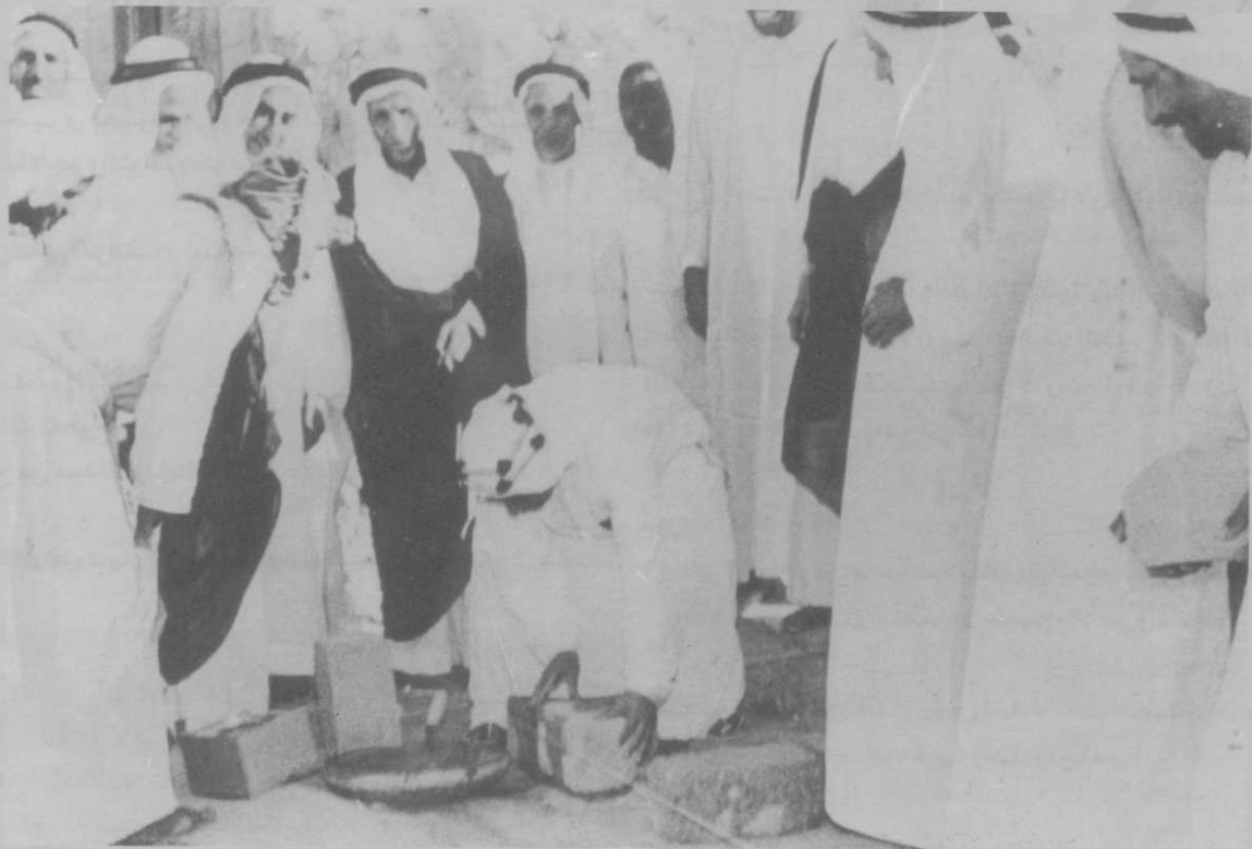
الشيخ عبدالله الجابر رحمه الله يضع حجر بناء أحد المساجد بحضور بعض أعضاء شؤون الأوقاف في الخمسينيات