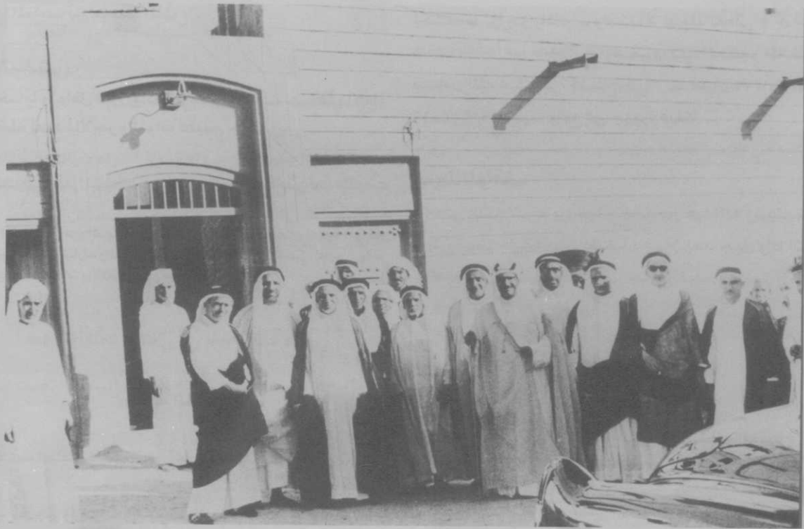
أعضاء مجلس شؤون الأوقاف برئاسة المغفور له الشيخ عبدالله الجابر أمام المبنى الذي خصصت به غرف لإدارة شؤون الأوقاف في الخمسينيات