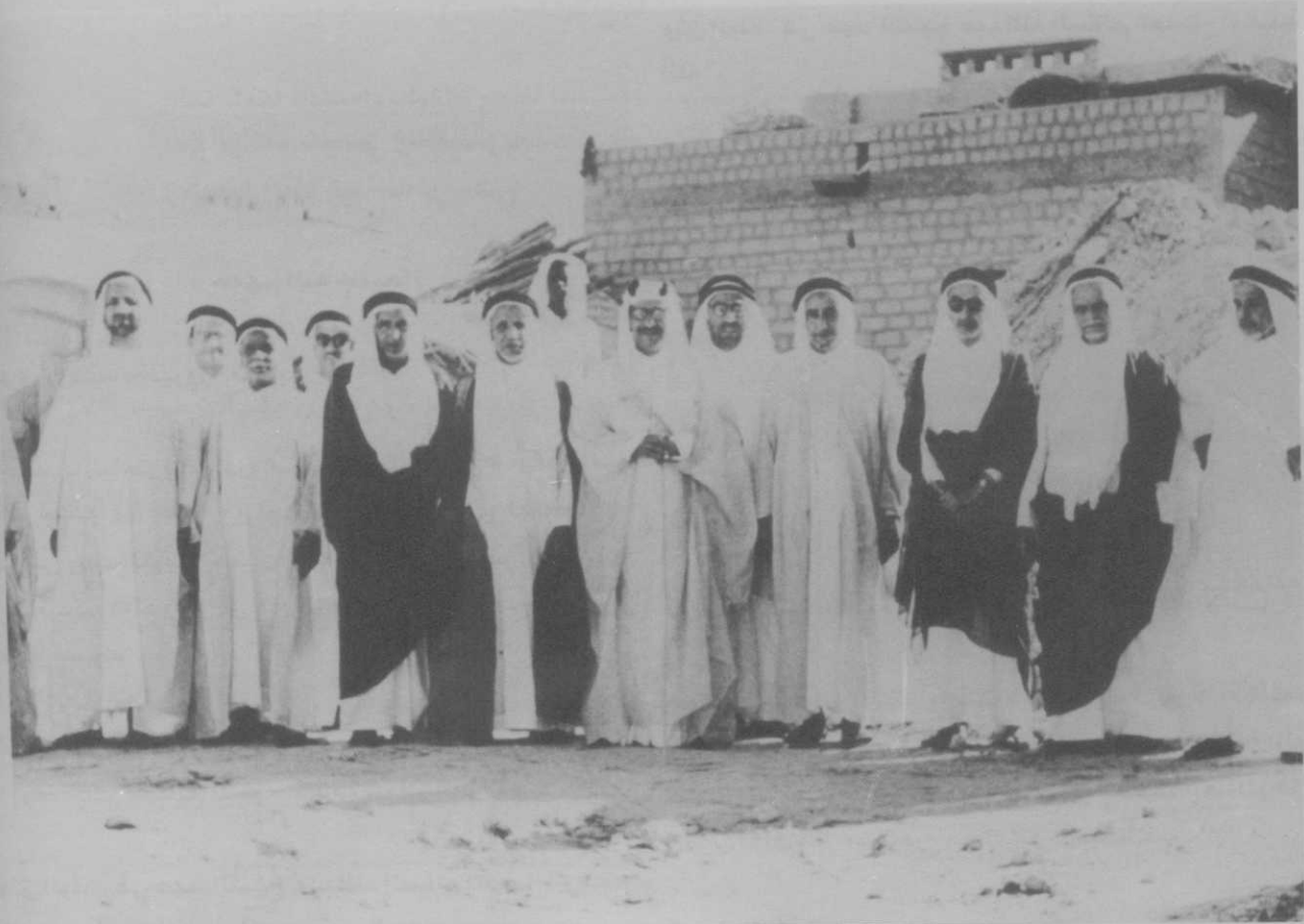
المغفور له الشيخ عبدالله الجابر الصباح رئيس مجلس شؤون الأوقاف وأعضاء المجلس في الخمسينيات في حفل وضع حجر أساس أحد المساجد