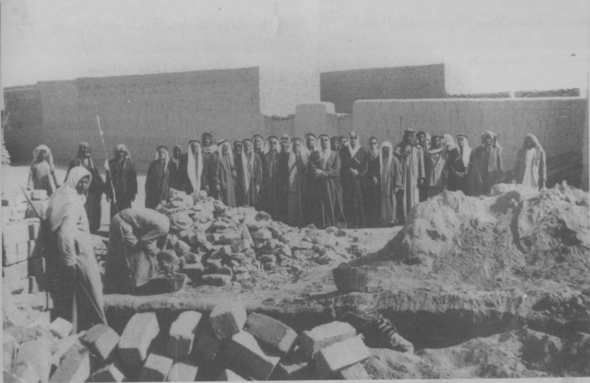
الشيخ عبدالله الجابر الصباح رئيس دائرة الأوقاف وبعض أعضاء مجلس شؤون الأوقاف يضعون حجر أساس بناء أحد المساجد